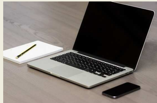
5S am Arbeitsplatz in Produktion und Büro

Auch wenn Sie bereits die 5S-Methode oder ähnliche Verfahren einsetzen, unterstützen wir Sie gern in speziellen Aufgabenstellungen.